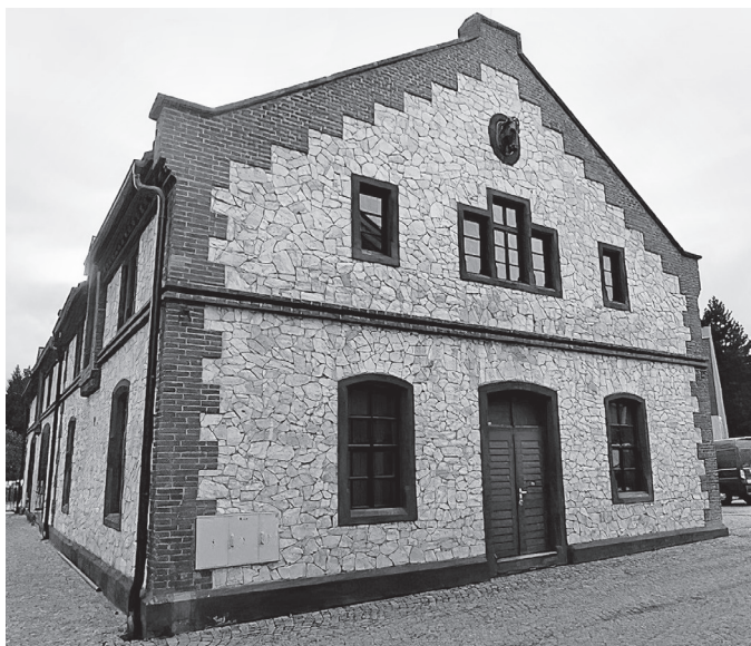
Obrázek 4. Antonín Goller, Kyklopská stáj v areálu zámku ve Vrchlabí, po 1864.