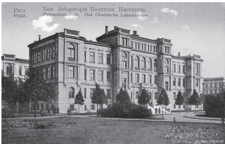
Obrázek 6. Johann Koch, budova fakulty biologie polytechnického institutu v Rize, do 1901. Dobová pohlednice [online], Nacionālā bibliotēka, Zuduši Latvija, https://dom.lndb.lv/data/obj/56378.html