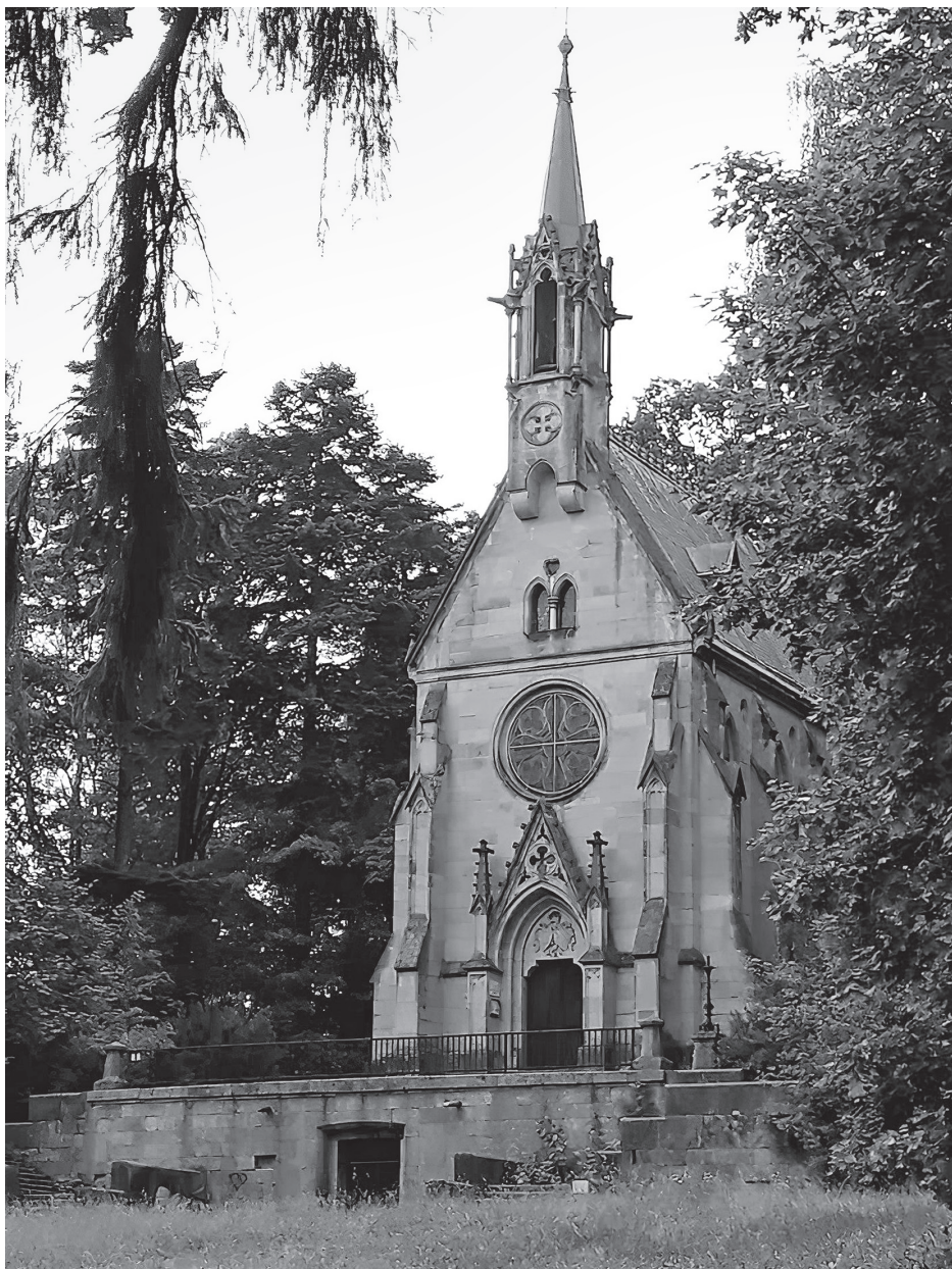
Obrázek 8. Stephan Tragl, Czernin-Morzinská hrobka ve Vrchlabí, 1887–1891.