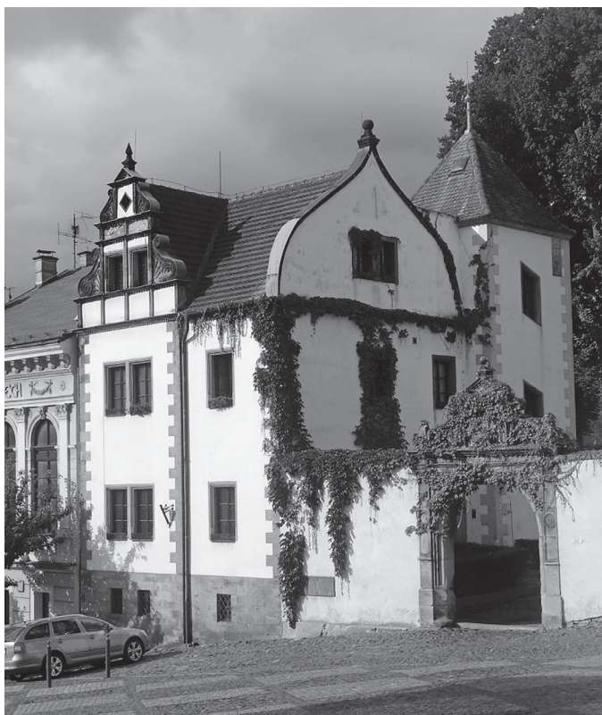
Obrázek 5. Johann Koch, Czernin-Morzinický palác v areálu Dolního zámku v Benešově nad Ploučnicí, po 1878.