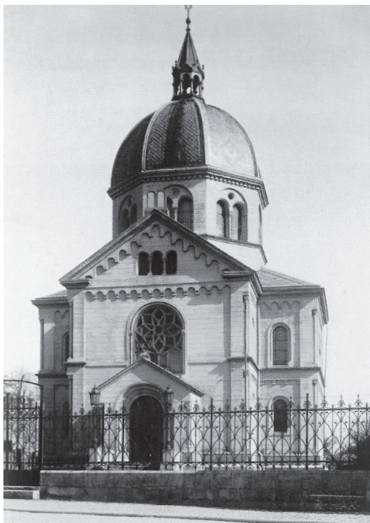
Obrázek 7. Stephan Tragl, synagoga ve Dvoře Králové, 1889–1891. Dobová pohlednice [online], http://znicenekostely.cz/?load=detail&id=17024