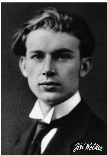
Obr. 2 Jiří Wolker