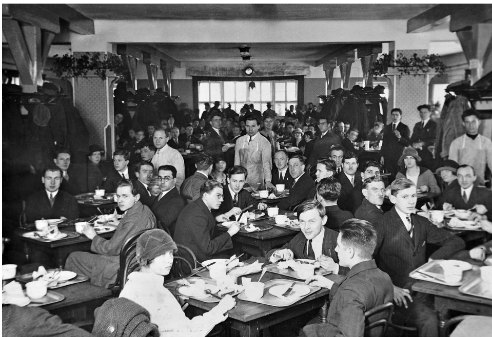
Obr. 3 Jídelna Studentského domova v Praze na Albertově (1921–1928), studie sleduje první stůl v levé řadě u stěny (ze sbírky Národního pedagogického muzea a knihovny J. A. Komenského, sign. F 323/6; digitální kopie Petr Šolar)