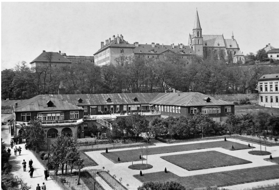
Obr. 1 Studentský domov v Praze na Albertově (1921–1928), celkový pohled na budovu