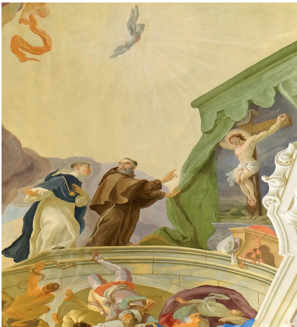
Obr. 4: Josef Stern (1716–1775): sv. Tomáš Akvinský a sv. Bonaventura na nástropní fresce kapucínské knihovny v Brně (mezi 1753–1775); Sbírký Provincie kapucínů v ČR; © Ambrož Guzek