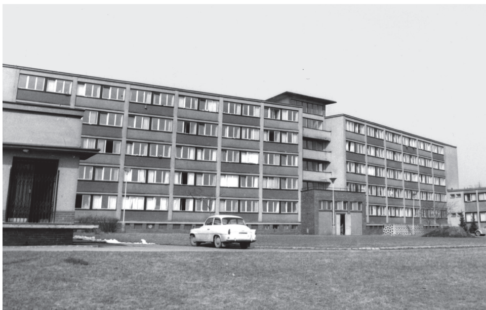
Větrník-jih (Hvězda), 70. léta 20. století, AUK, f. Fotoarchiv, pozitivy, budovy

Vzhledem k počtu studentů ubytovaných na této koleji a k různorodosti zájmů způsobených částečně diferenciací studentů podle fakult 125 se kolejní rada snažila připravit program klubu, který by odpovídal zájmům všech studentů na této koleji. Kolejní radě se také podařilo zajistit pravidelné vystupování předních československých jazzových skupin (např. Jazz Q vedený Jiřím Stivínem). Klub také poskytoval svým návštěvníkům široký sortiment jídel a nápojů, čímž se částečně snažil nahradit neexistující menzu. K vybavení klubu patřila rovněž hrací skříň, magnetofon a různé společenské hry. Ceny v kolejním klubu odpovídaly zhruba II. až III. cenové skupině.